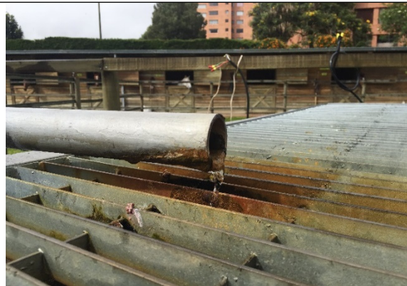
Fotografía 1. Naturaleza saltante del pozo identificado con el código pz-01-0004