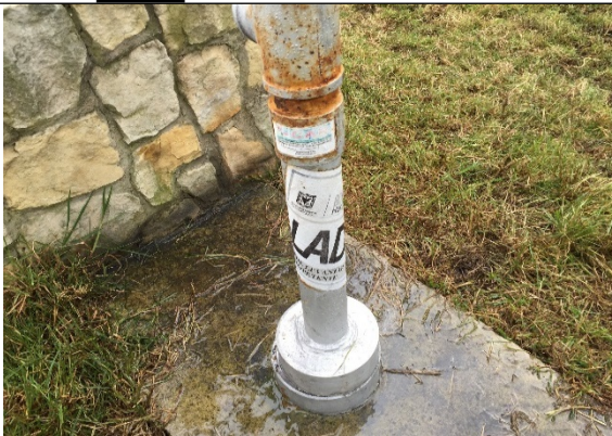
Fotografía 2. Sellos de papel impuestos por la CAR y la SDA al pozo Country Club No. 2