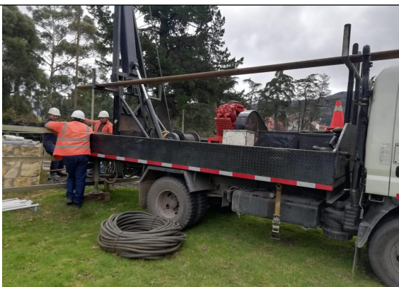
Fotografía 4. Uso de grúa para retirar tubería de explotación y línea de conducción de aire con la cual se extraía el agua del pozo.