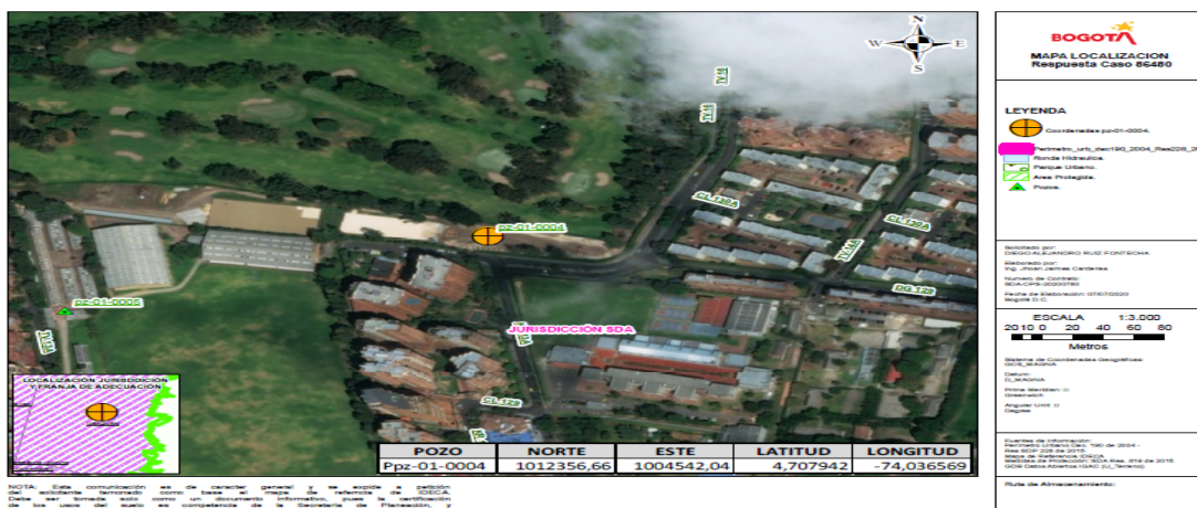
Figura 3. Mapa de localización del pozo pz-01-0004 (SDA, 2020)

Dentro de la documentación presentada por el usuario en el radicado 2019ER260181 del 06 de noviembre de 2019, se presenta informe de georreferenciación y nivelación del pozo objeto de evaluación. A través de la Mesa de Servicios de la Entidad, se solicitó la revisión de dicha información, indicando que procedimiento y documentación, así como las coordenadas resultantes de localización del pozo, cumplen con la localización y los estándares exigidos por la SDA; tal y como lo muestra salida gráfica del punto con las coordenadas del levantamiento topográfico que se presentan en la siguiente figura.