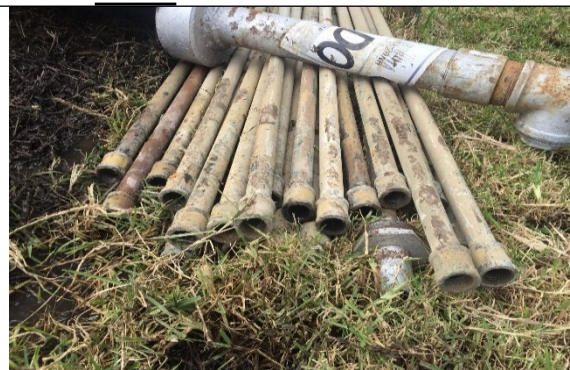
Fotografía 6. Tubería de conducción de aire de 1" en acero galvanizado retirada del pozo.

Una vez extraída la tubería de producción y la línea de conducción de aire, se genera turbulencia en el pozo agitando la columna de agua almacenada al interior de este; lo cual impidió la toma del video y su reprogramación. El día 25 de julio de 2019, se adelanta la toma del video al interior del pozo para verificar su estado mecánico y diseño constructivo (fotografías 7-8); evidenciando que la tubería de revestimiento, uniones roscadas y reducción se encuentran en buen estado, permitiendo establecer el diseño del pozo hasta la profundidad a la cual bajó la cámara por colmatación del pozo de sedimentos (Tabla 3).