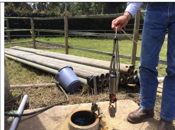
Fotografía 7. Cámara empleada para la toma de video al interior del pozo.

Una vez extraída la tubería de producción y la línea de conducción de aire, se genera turbulencia en el pozo agitando la columna de agua almacenada al interior de este; lo cual impidió la toma del video y su reprogramación. El día 25 de julio de 2019, se adelanta la toma del video al interior del pozo para verificar su estado mecánico y diseño constructivo (fotografías 7-8); evidenciando que la tubería de revestimiento, uniones roscadas y reducción se encuentran en buen estado, permitiendo establecer el diseño del pozo hasta la profundidad a la cual bajó la cámara por colmatación del pozo de sedimentos (Tabla 3).