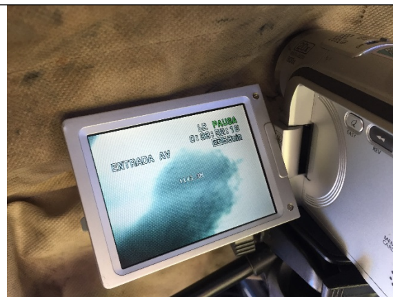
Fotografía 8. Video realizado al interior del pozo con el cual se verifica su diseño constructivo y estado mecánico.