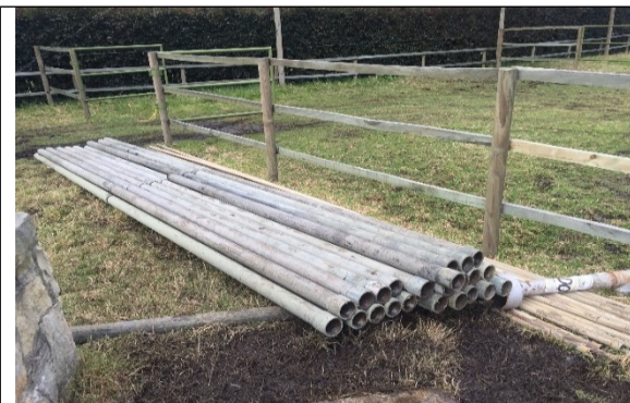
Fotografía 5. Tubería de producción de 3" en acero galvanizado retirada del pozo.