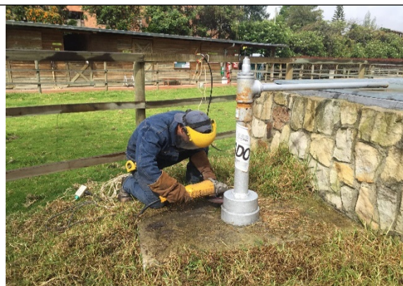
Fotografía 3. Intervención de la boca del pozo para poder adelantar la toma de video al interior de este para verificar su estado.